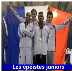
Les épéistes juniors

3ème des championnats d'Europe futsal. Ciechanow (Pologne), novembre 2013.